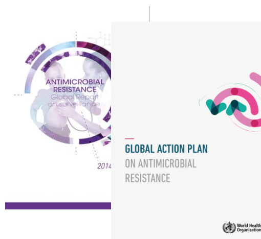
Rysunek 1 Raport Światowej Organizacji Zdrowia „Oporność drobnoustrojów na antybiotyki: raport podsumowujący monitorowanie antybiotykooporności na świecie w 2014 r.” (kwiecień 2014 r.) oraz „Światowy plan działania w zakresie antybiotykooporności” przyjęty przez Światowe Zgromadzenie Zdrowia (2015 r.)