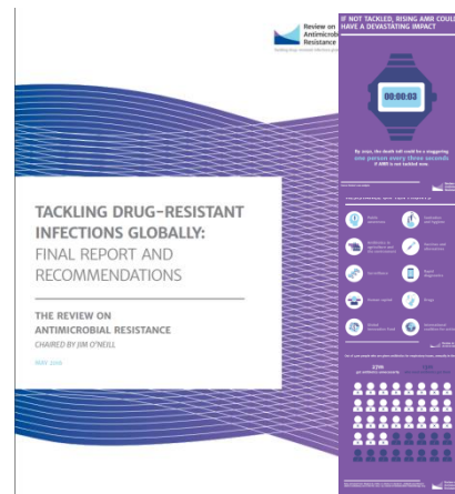
Rysunek 3 Raport „Globalna walka z zakażeniami wywołanymi przez wielooporne drobnoustroje – rekomendacje i raport końcowy” ( Tackling drug-resistant infections globally – final report and recommendations ), Jim O’Neill, Maj 2016 i przykładowe infografiki raportu.

skalę problemu antybiotykooporności i wyznacza podstawowe obszary do walki z nim. Z raportu wynika, że około 700 000 osób umiera rocznie z powodu infekcji wywołanych przez antybiotykooporne drobnoustroje, a przy braku odpowiednich działań zapobiegawczych w 2050 r. liczba ta wzrośnie do 10 milionów rocznie. Na podstawie danych amerykańskich raport szacuje również, że na około 40 milionów osób które otrzymywały antybiotyki w przebiegu infekcji układu oddechowego 27 milionów osób (67,5%) otrzymywało je niepotrzebnie, a tylko 13 milionów (32,5%) osób naprawdę ich potrzebowało. Wśród obszarów, w których należy podjąć działania celem walki z antybiotykoopornością dokument wymienia m.in. globalne kampanie edukacyjne, poprawę standardów sanitarnych i zapobieganie rozprzestrzenianiu się infekcji, ograniczanie niepotrzebnego stosowania antybiotyków w rolnictwie i zapobieganie ich rozprzestrzenianiu się do środowiska, globalne monitorowanie antybiotykooporności i konsumpcji antybiotyków w medycynie, weterynarii i produkcji żywności, wspieranie nowych metod diagnostycznych zapobiegających niepotrzebnemu stosowaniu antybiotyków, promowanie szczepień i opracowywanie nowych szczepionek, zapewnienie wystarczającego zaplecza do walki z zakażeniami, wspieranie inicjatyw zmierzających do opracowania nowych leków i strategii walki z zakażeniami bakteryjnymi.