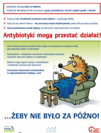
Rysunek 4 Przykładowy plakat Europejskiego Dnia Wiedzy o Antybiotykach.

najbardziej aktualne z punktu widzenia zagrożeń epidemiologicznych zagadnienia. Kampania ma zwrócić uwagę na zagrożenie utratą skuteczności antybiotyków w efekcie nieracjonalnego ich stosowania.